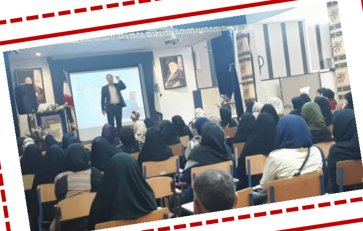
سخنرانی دکتر مهاجر در مورد هدایت تحصیلی